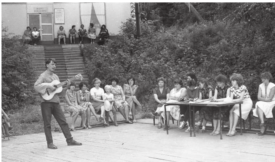
Фестиваль художественной самодеятельности на турбазе «Ивушка», 1985 год

В июне 1982 года начал действовать новый спальный корпус на 72 места. Появились новые возможности для круглогодичного приема отдыхающих, увеличения их численности, условий проживания, разнообразия форм досуга. В начале каждого года утверждались прейскуранты цен. В 1989 году